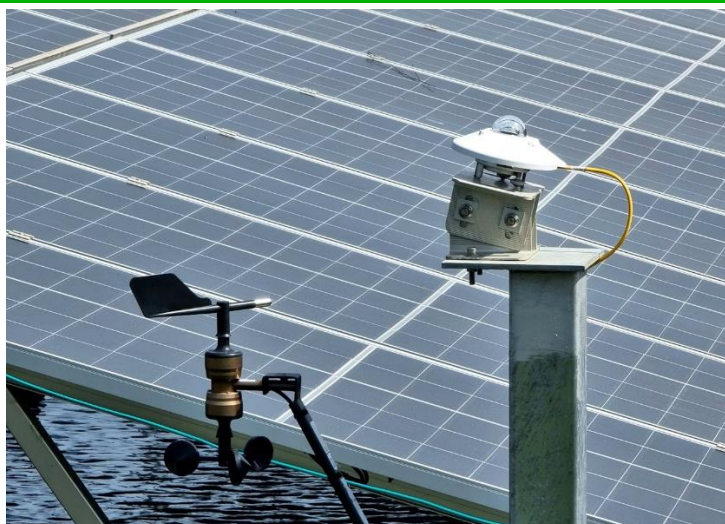
Рис. 2. Расположение пиранометра, установленного на солнечной панели

Пиранометр позволяет точно измерять уровень солнечной радиации и на этой основе определять идеальное, то есть ожидаемое значение электрического выхода для чистой панели. Затем это идеальное значение сравнивается с фактически измеренным значением, полученным от панели.