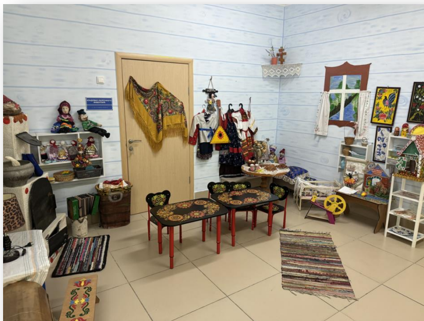
Рис.1. Мини музей «Русская изба»

развивающее пространство, где каждая задача патриотического воспитания находит свое практическое воплощение.