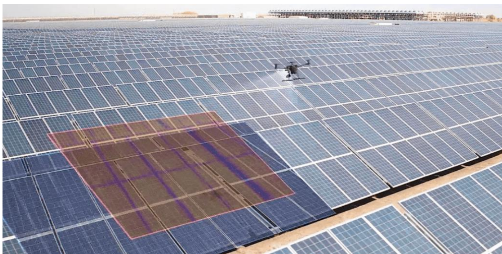
Рис. 3. Мониторинг панели с помощью дрона

изображений выявляются пыль, пятна и другие загрязняющие элементы на поверхности панели, а также оценивается их влияние.